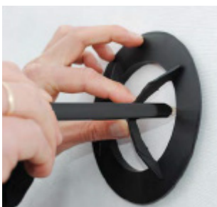
Marker og skær hul i undertaget.