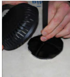
Hold fast i stripsen og monter overdelen.