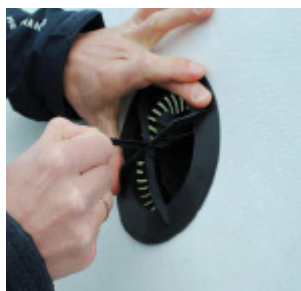
Dækslet trækkes tramt ned til undertaget indefra.