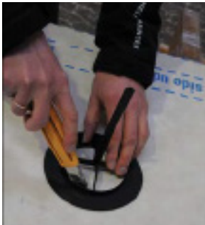
Marker og skær hul i undertaget.