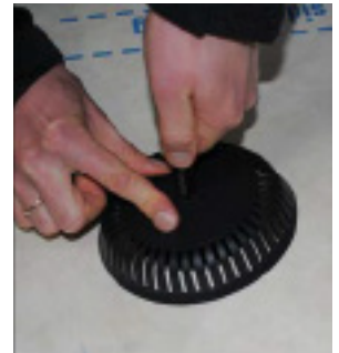
Overdelen presses ned mod undertaget.