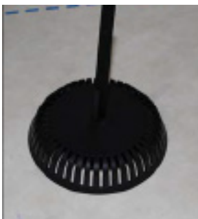
Undertagsventilen er nu monteret.