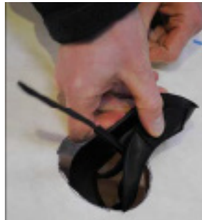
Pres underdelen sammen og før den ind på bagsiden af undertaget.