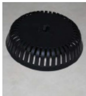
Færdigmonteret set udefra.