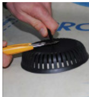
Stripsen skæres af ca. 1 cm over dækslet.