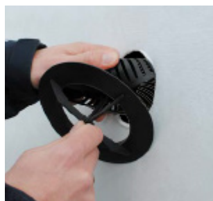
Pres undertagesventilen sammen, så undertaget er placeret mellem dækslet og underdel.