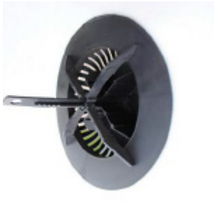
Ventistuds færdigmonteret set indefra.